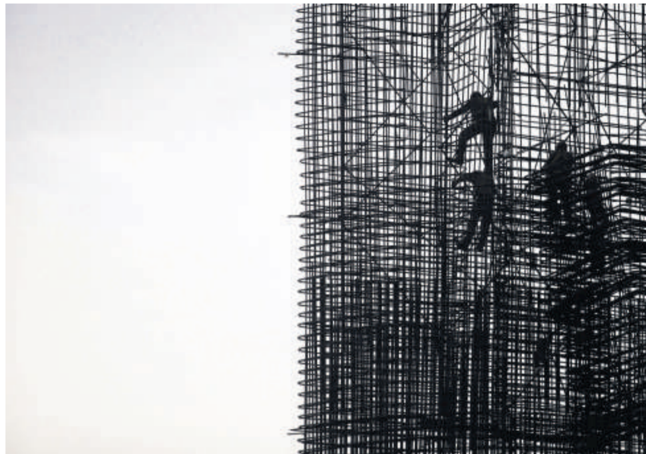
Wer körperlich nicht zu hart arbeiten muss, bewahrt sich die Arbeitsfähigkeit bis ins hohe Alter.